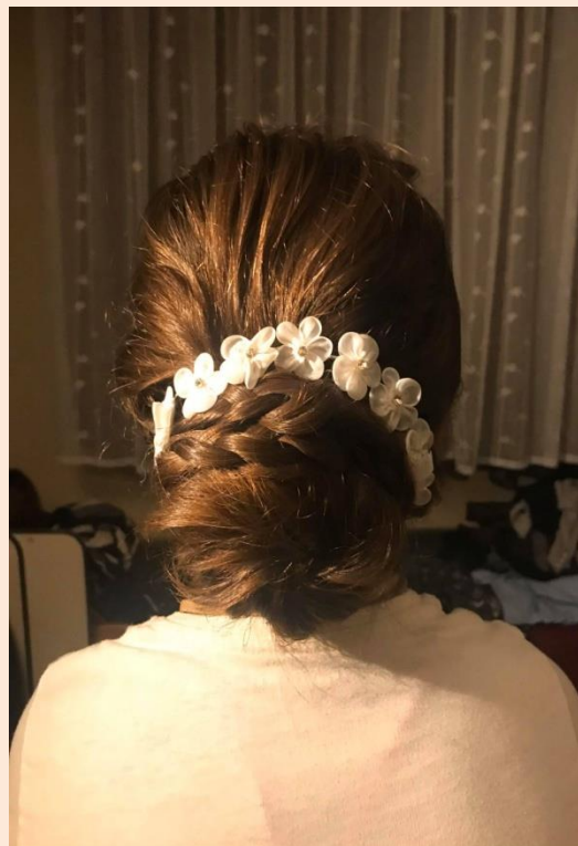
Uczesania wykonane przez nasze uczennice.